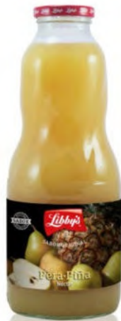
Pera - Piña