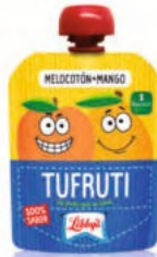
Melocotón - Mango