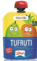
Pera - Piña