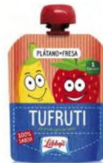
Plátano - Fresa