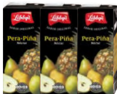
Pera - Piña