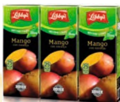
Mango con naranja