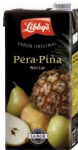
Pera - Piña