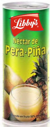
Pera - Piña